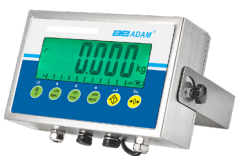
AE 403 Indicator