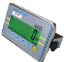
Indicateur de Pesée AE 402