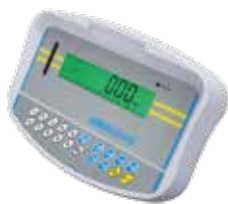
Indicateur de Pesée GK