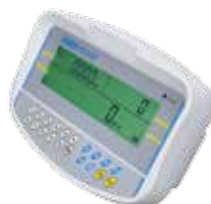
Indicateur de Pesée GC